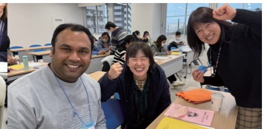
なかま 仲間ができる

たいしょうしゃ けんそく いか ようけん み もの 対象者 原則、以下の要件をすべて満たす者