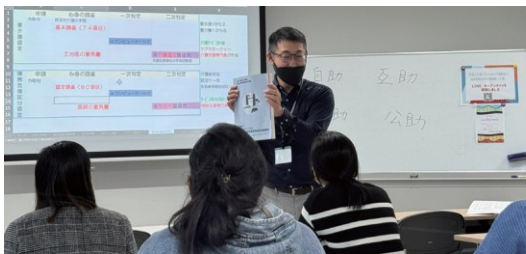
がくしゅう 学習ポイントがわかる