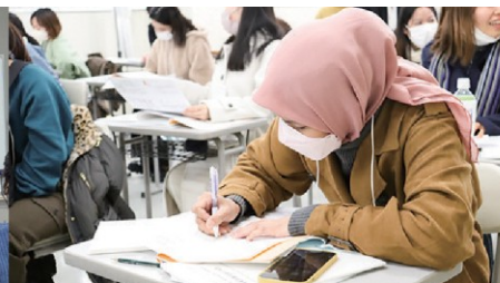
かえ くり返し勉強できる